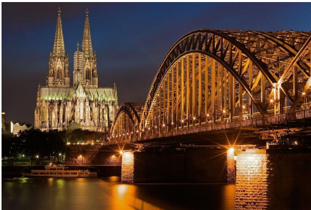
↑ケルンの象徴：大聖堂とホーエンツォレルン橋